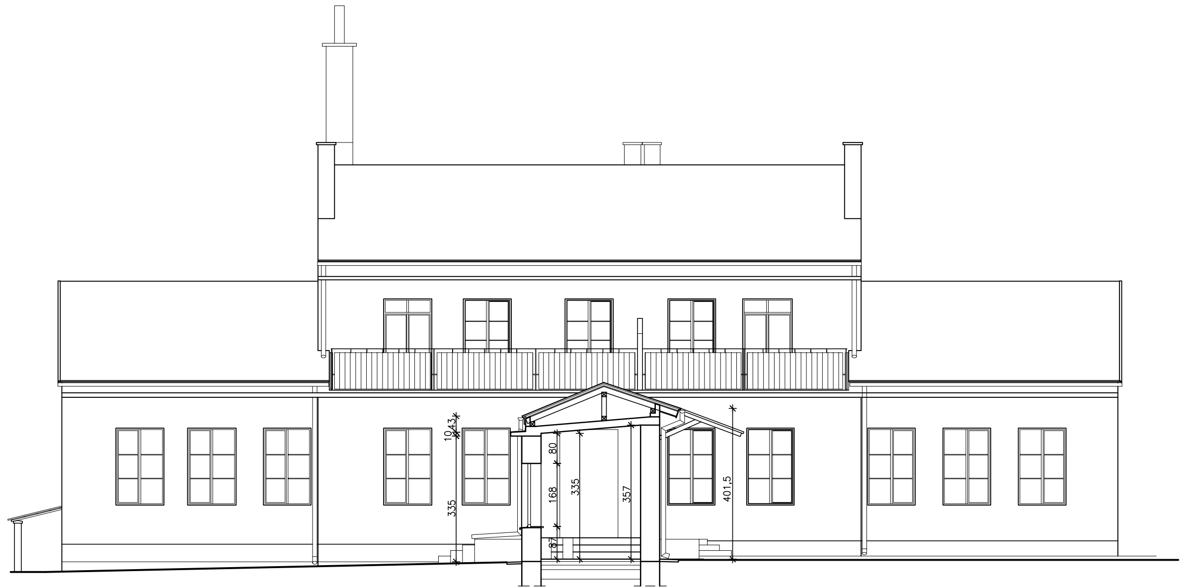
PRZEKRÓJ D-D 1:100 ELEWACJA POŁUDNIOWA 1:100